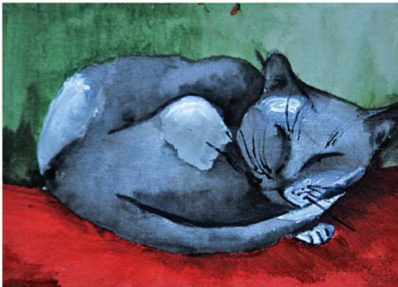
„Sen” - 2014r.