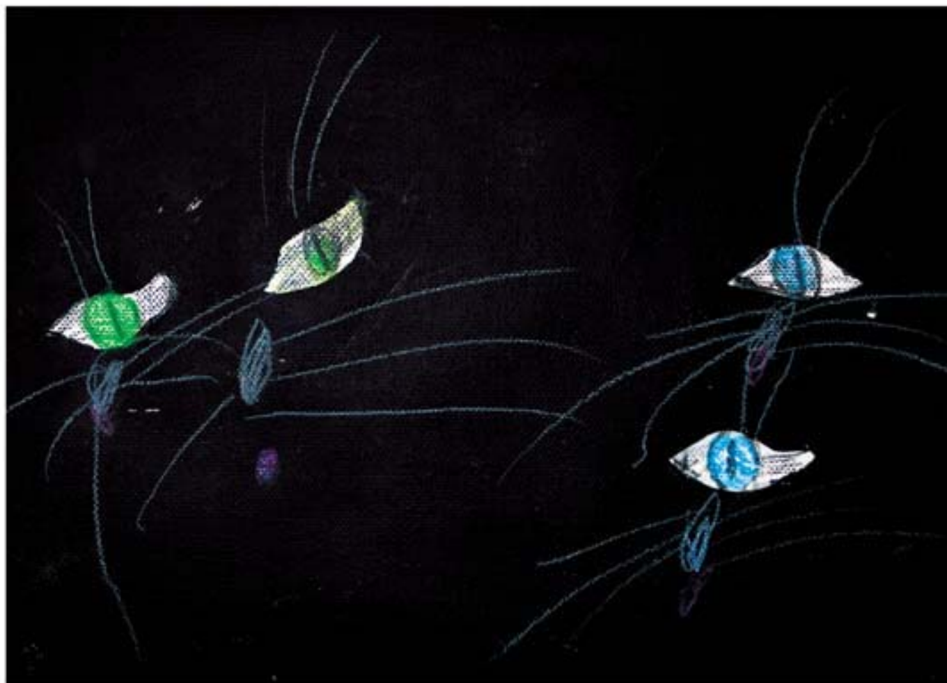
„W nocy” - 2014r.