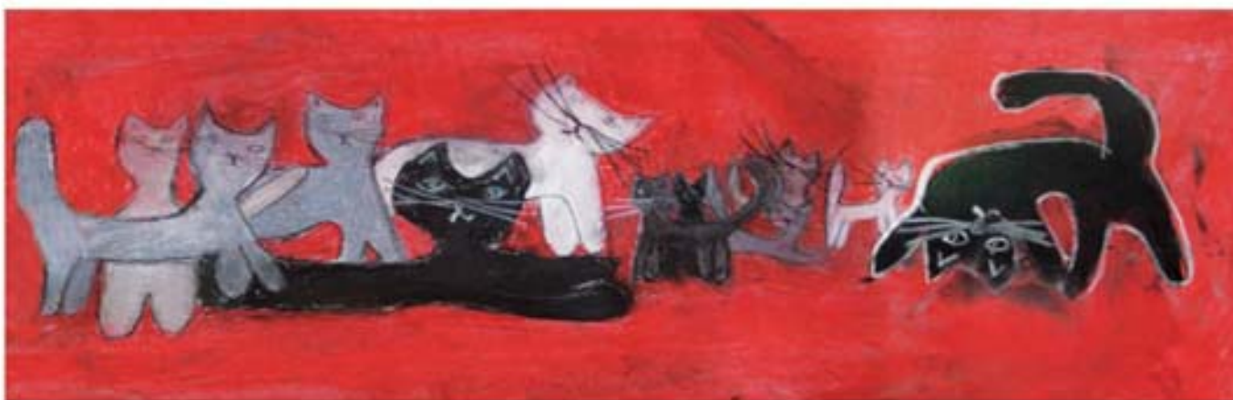
„Kocie sprawy” - 2015r.