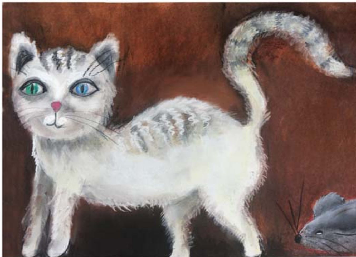
„Julianka” - 2014r.

Laureatka wielu konkursów organizowanych przez CKiP w Brzeźnicy, GOK w Tomicach oraz SP w Brzeźnicy, gdzie jest autorką zwycięskiego projektu na mural dla szkoły. Nominowana w konkursie organizowanym przez WCK w Wadowicach do nagrody „Talenty 2014”.