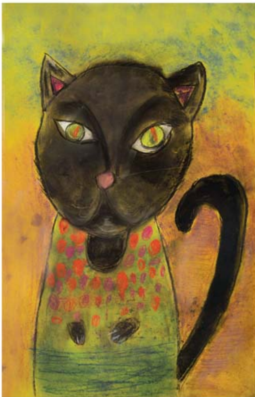
„Bocia” - 2014r.