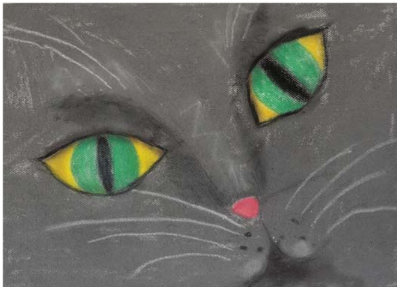
„Magnetyzm” - 2014r.