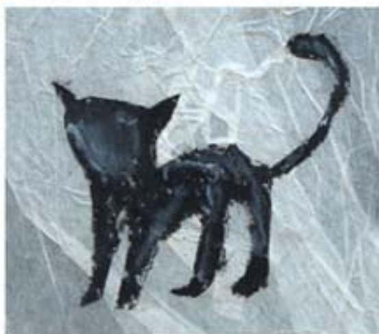
„Multiplikacje” - 2014r.