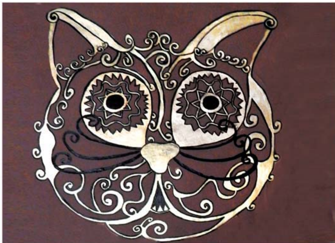
„Kot Orientalny” - 2015r.