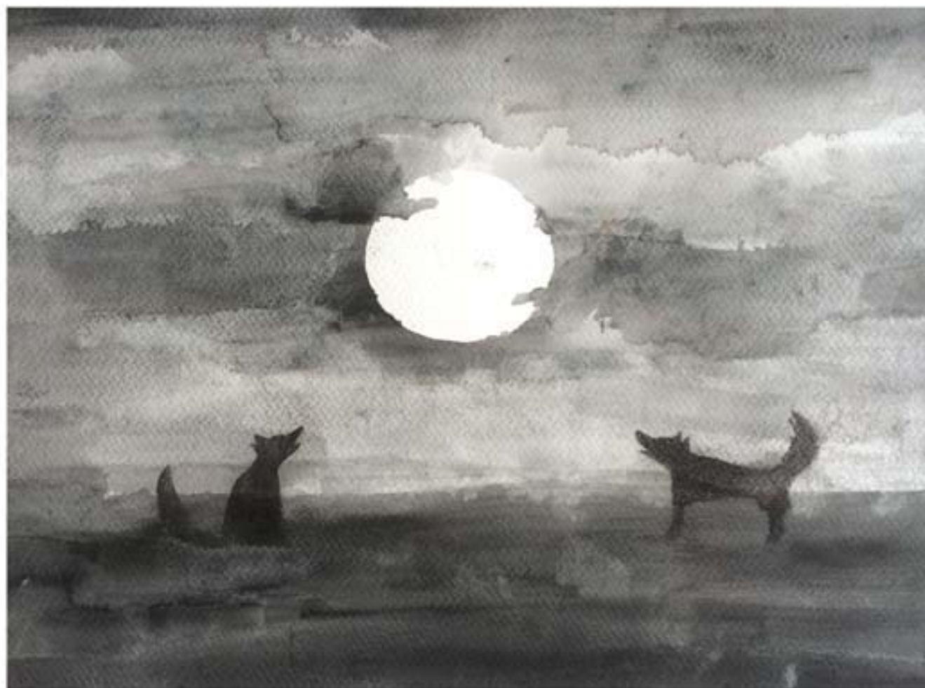
„Północ” - 2014r.